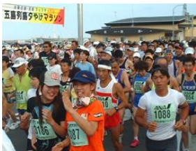
レース後の五島牛試食会を楽しみにスタート