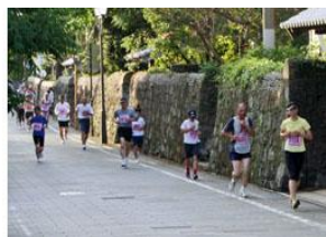
夕陽を浴びて武家屋敷通りを走るランナー(5km)