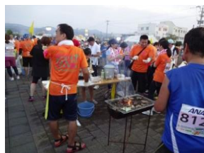
試食会ながらたっぴりの五島牛で大満足