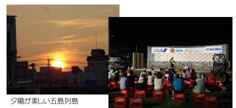
夕陽が美しい五島列島