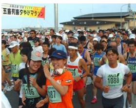
レース後の五島牛試食会を楽しみにスタート