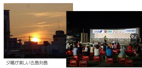
夕陽が美しい五島列島