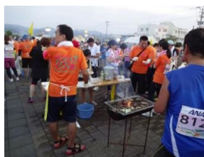
試食会がならたつりの五島牛で大満足