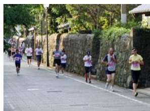
夕陽を浴びて武家屋敷通りを走るランナー(5km)