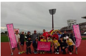
2019おきなわマラソンツアー記念撮影

※各フライト時間帯での便名・時刻の指定はできません。 ※大阪発3日間コースは伊丹発着、2日間コースは関空発着となります。 ※上記以外の発着地や時間帯、延泊等をご希望の方はお問合せください。 ※フライトスケジュールは航空会社の都合により変わる場合がございます。