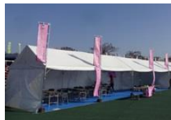
フィニッシュとなる競技場内にツアーの専用テントを設置して選手をサポート!!