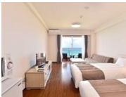
アネックスのお部屋には冷蔵庫、キッチン(HI)、電子レンジが完備