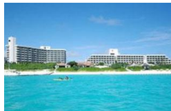
*空港送迎サービスあり(事前予約制) *大会会場まで約2km。大会当日は選手送迎バスを大会主催者が運行。

ホテルの目の前に広がる「与那覇前浜ビーチ」は日本のベストビーチに選ばれる程の美しさで、疲れたからだを癒してくれるでしょう。レストラン、ショップ、スパなどの施設も充実しリゾートステイをお楽しみいただけます。