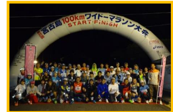
宮古島100kmワイドーマラソンツアー記念撮影 (100km参加の選手みなさんでスタート前に)

※大会前日の宿泊先～受付会場間、ならびに大会当日の宿泊先～スタート/フィニッシュ会場間は大会主催者運行の選手送迎バスをご利用いただきご自身で移動となります。