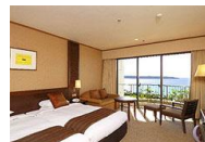
オーシャンウイングスタンダードツインルーム