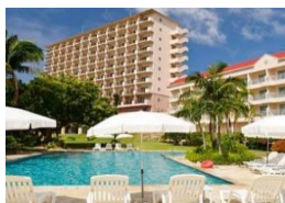
*空港送迎サービスあり(事前予約制) *大会会場まで約5km。大会当日は選手送迎バスを大会主催者が運行。

ドイツ文化村に隣接し美しい海の目の前に建つ自然溢れるリゾートホテル。中庭には一年中美しい花々が咲き誇り、南国リゾートステイを満喫いただけます。タワー館・アネックスは全室オーシャンビュー。リゾート気分でお寛ぎいただけます。