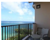
タワー館のバルコニーから美しい海を臨む