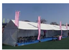
フィニッシュとなる競技場内にツアーの専用テントを設置して選手をサポート!!