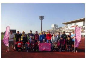
2017おきなわマラソンツアー記念撮影

※各フライト時間帯での便名・時刻の指定はできません。 ※上記以外の発着地や時間帯、延泊等をご希望の方はお問合せください。 ※フライトスケジュールは航空会社の都合により変わる場合がございます。