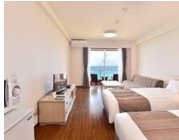
アネックスのお部屋には冷蔵庫、キッチン(HI)、電子レンジが完備