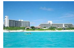
*空港~ホテル間の送迎サービスあり(事前予約制) *大会会場まで約2km。大会当日は選手送迎バスを大会主催者が運行。

ホテルの目の前に広がる「与那覇前浜ビーチ」は日本のベストビーチに選ばれる程の美しさで、疲れたからだを癒してくれるでしょう。レストラン、ショップ、スパなどの施設も充実しリゾートステイをお楽しみいただけます。