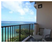
タワー館のバルコニーから美しい海を臨む