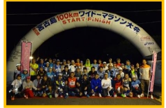
宮古島100kmワイドーマラソンツアー記念撮影 (100km参加の選手みなさんとスタート前に)

※大会当日の宿泊先~スタート/フィニッシュ会場間は大会主催者運行の選手送迎/バスをご利用いただきご自身で移動となります。