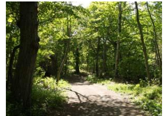
週末、森林浴マラソンでリフレッシュしてみませんか?